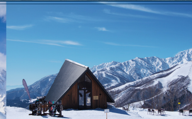
白馬岩岳スノーフィールド