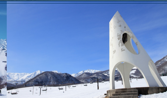
つがいけマウンテンリゾート