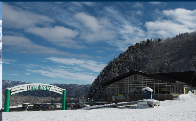
Hakuba47ウインタースポーツパーク