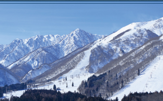
エイブル白馬五竜

※「白馬EXアドベンチャー」「HAKUBA47マウンテンスポーツパーク」「白馬つがいけWOW!」はグリーンシーズンのみの営業となります。