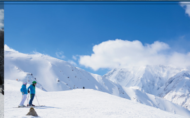
白馬八方尾根スキー場